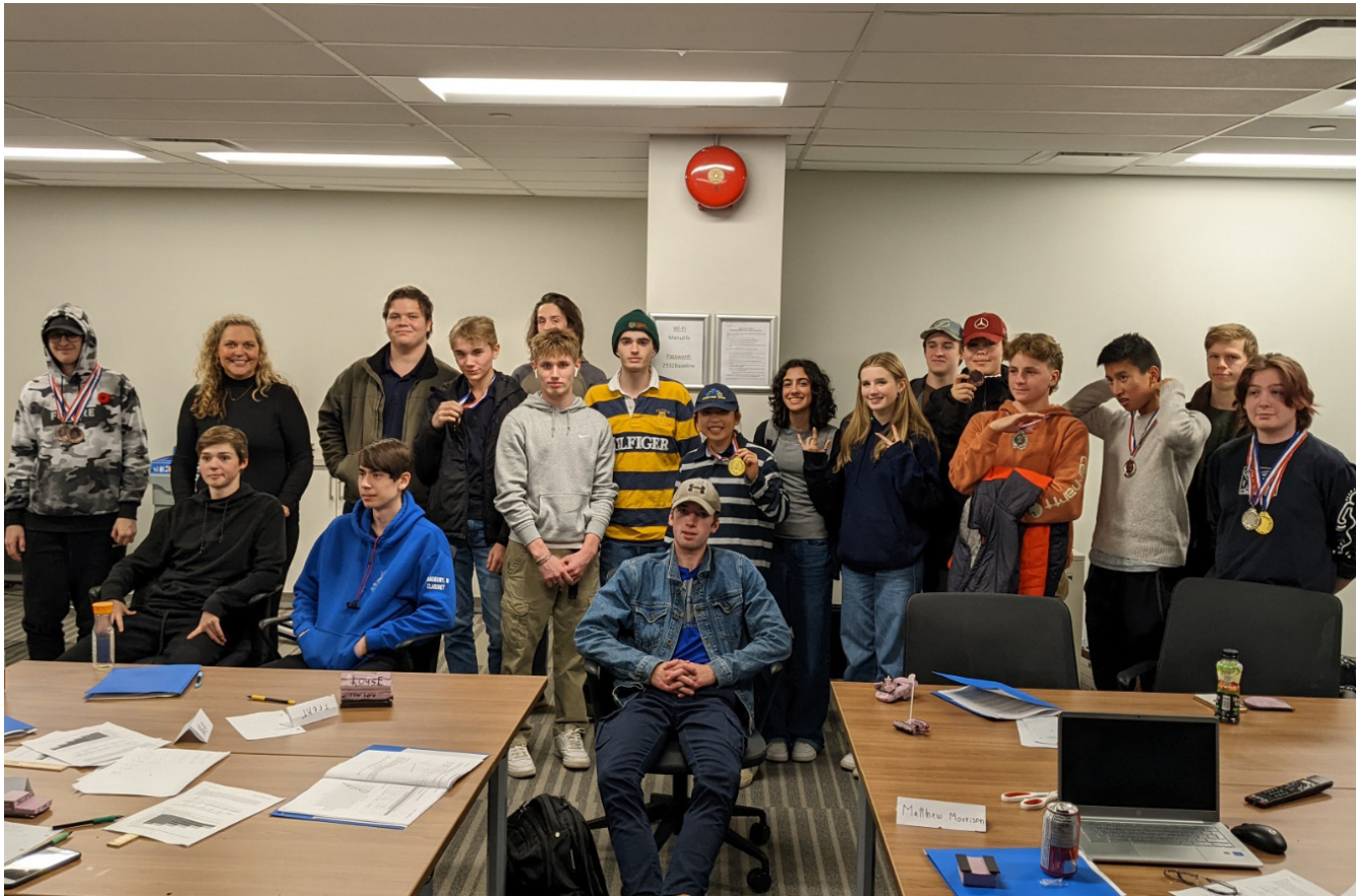
Groupe d'élèves lors de la séance du programme TRAC en 2022

Une autre séance du programme TRAC d'une journée entière est prévue le vendredi 22 septembre de cette année à Ottawa, au Centre Shaw, en marge du congrès et de l'exposition 2023 de l'ATC.