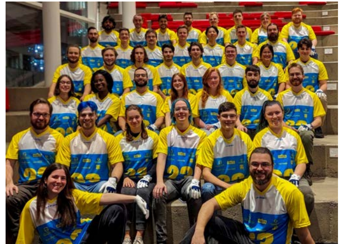
Délégation d'ÉTS Montréal aux Jeux du Génie du Québec 2023

En 2022, la Fondation a appuyé une délégation étudiante d'ÉTS Montréal pour leur participation aux Jeux de Génie du Québec 2023. La photo suivante montre l'équipe participante.